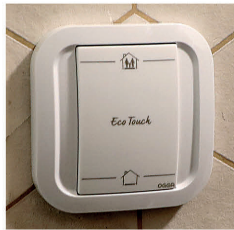
Bouton Eco Touch pour activer le chauffage et les éclairages selon votre présence ou votre absence.