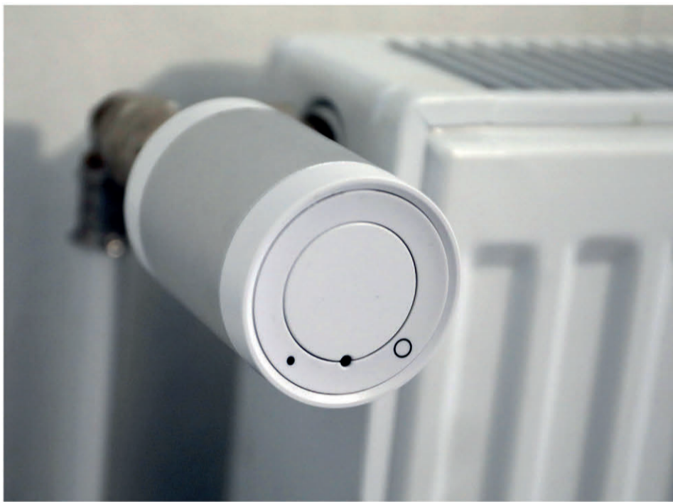
Pilotage des radiateurs grâce à des vannes thermostatiques.

coupe le radiateur de la pièce. Heure de rentrée, du coucher, du lever : l'intelligence de ces objets connectés réside dans leur capacité à apprendre des usages des locataires et de leurs habitudes. Grand Dijon Habitat a équipé les 40 premiers appartements à l'automne dernier, les 63 autres le seront pendant l'été 2023. Orvitis prévoit de terminer l'installation de ses 30 logements pilotes pour le 15 mars 2023.