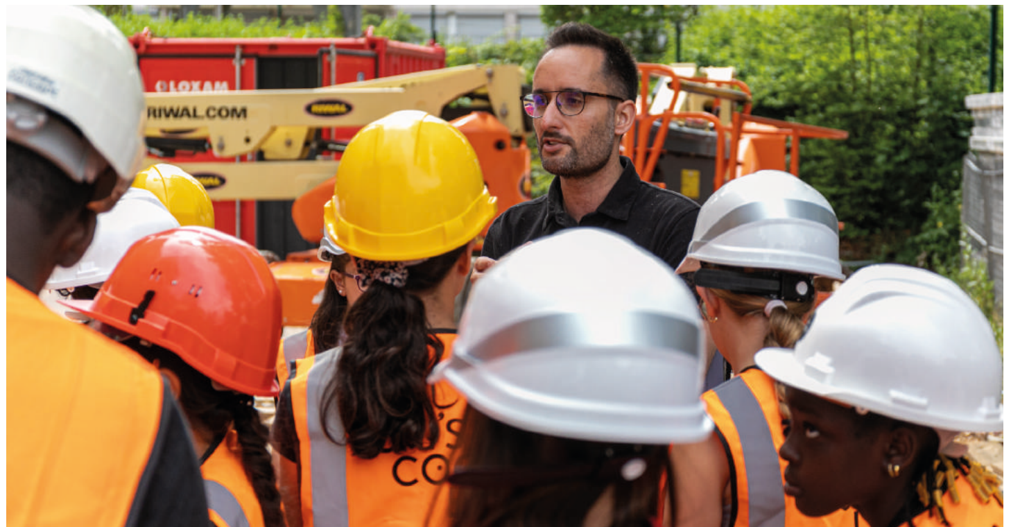
Les Ateliers Archi-cools du cabinet d'architectes Archiducs ont emmené, le 22 juin dernier, les élèves de primaire de l'école Buffon sur le chantier de leur école.

Les travaux de rénovation énergétique et thermique de l'école Buffon sont financés par l'Union européenne et l'ANRU. À terme, le programme permettra de produire 200 kVA d'électricité avec 600 panneaux solaires et de réaliser 60 % d'économie d'énergie.