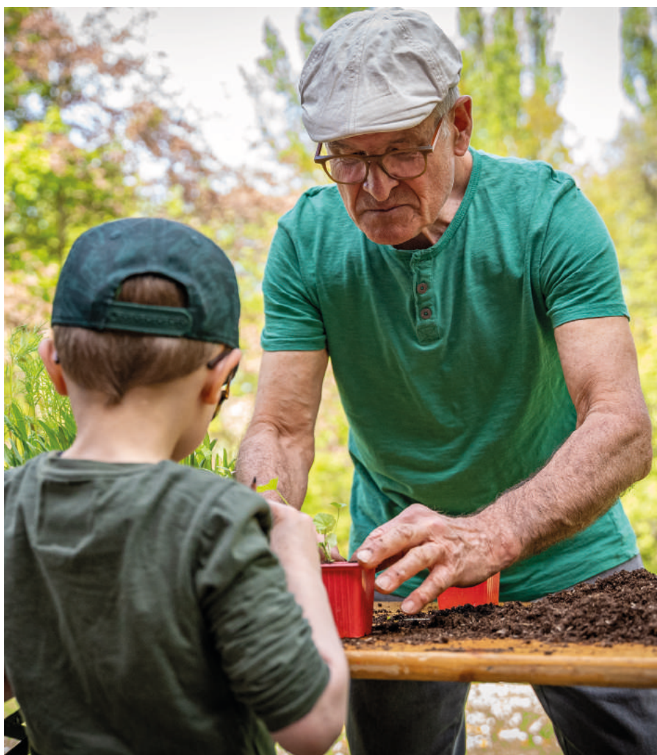
Des participants préparent les futurs plants.