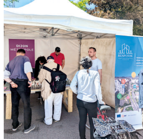
Stand Response - Jours de fête à Fontaine d'Ouche.

de la danse pour déambuler dans une farandole artistique et féérique. Grandiose ! Une journée intense pour un quartier plein d'énergie.