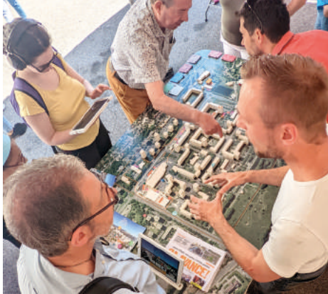
Présentation pédagogique de la maquette Response lors de Jours de fête à Fontaine d'Ouche.

Les associations s'étaient donné rendez-vous pour la 41 e édition du festival Jours de fête à Fontaine d'Ouche .